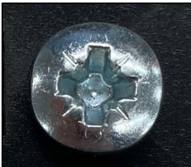
従来品の工具穴形状：ポジドライブ仕様