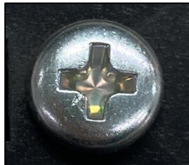
変更品の工具穴形状：プラス仕様